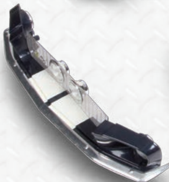
Передняя часть кузова